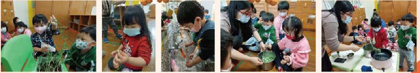
在地食材-麥蕪餅：拔蕪、去根和泥土、洗蕪、加太白粉和鹽巴攪拌、倒進鍋裡煎熟