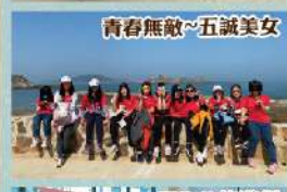
青春無敵~五誠美女