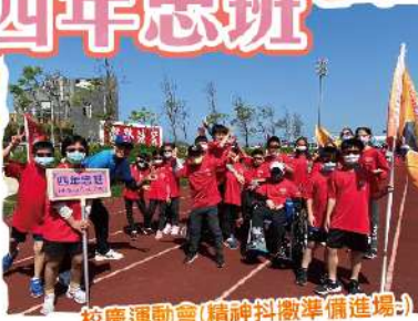
校慶運動會(精神抖擻準備進場)