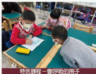
特色課程—會呼吸的房子

今天，我的堂弟來我家住，我們晚上八點三十分的時候一起泡澡，我們泡澡的時候玩了可愛的恐龍玩具和超炫的車子，真開心！睡覺前堂弟像吱吱喳喳的小鳥一樣不停說話，當他睡著的時，還一直打呼，打呼聲就像「轟隆！轟隆！」的打雷聲一樣響亮，害我整晚都睡不好。