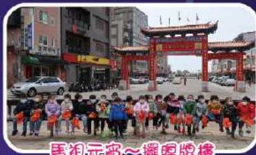
馬祖元宮~擺頭牌樓