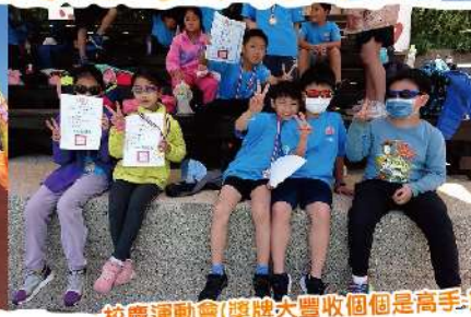
校慶運動會(獎牌大豐收個個是高手)