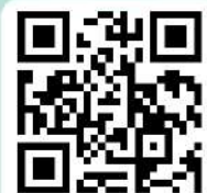
愛講馬祖話 播放清單連結

本土教育面向廣泛，除了語言、文化、風俗、習慣及景觀之外，其施教主軸是冀望孩子們從認識家鄉、珍惜家鄉與保護家鄉的行動中，建構族群認同與孕育人文關懷之底蘊。