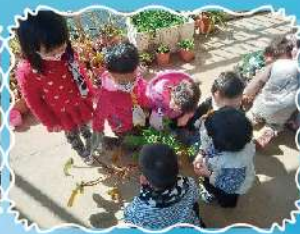
觀察種植的櫻桃蘿蔔