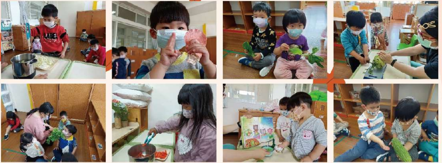
我們吃了：大白菜、粉紅菇、青江菜、大頭菜、芹菜、胡蘿蔔、青椒、苦瓜……等等