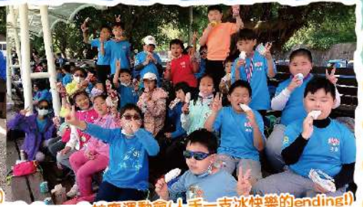
校慶運動會(人手一支冰快樂的ending!)