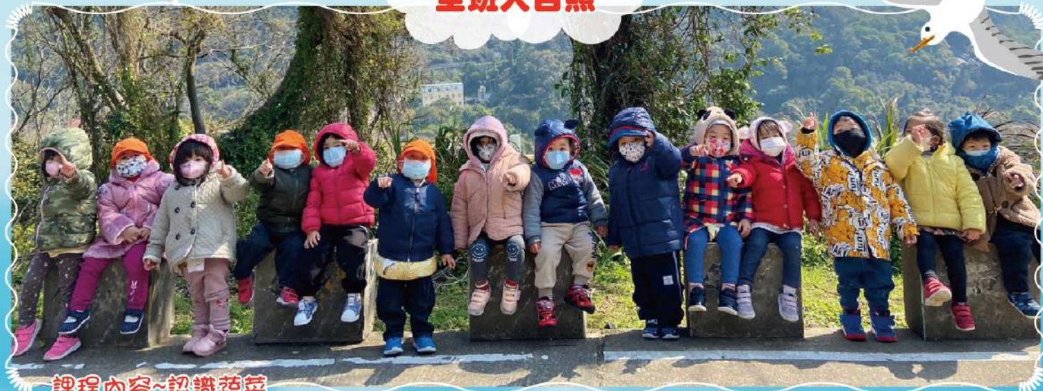
課程內容~認識蔬菜