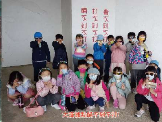
大漢據點誰不到不打!

走到海邊，聞到海水鹹鹹的味道，看到小小的螃蟹走在金黃色的沙灘上，感覺隨時會被夾到一樣。看著天上飛的海鷗，一不注意我跌進海水裡，不小心吞了一大口海水，哇！好鹹啊！