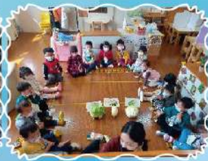
認識我們常吃的蔬菜