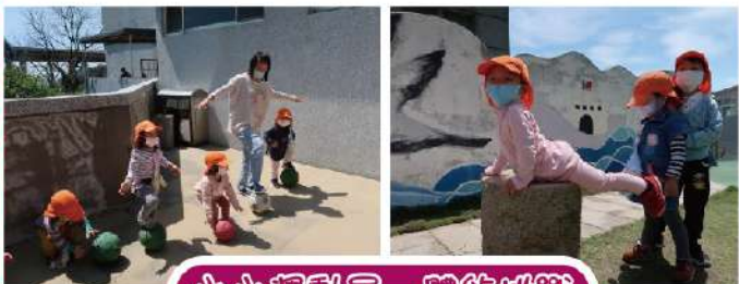
小小運動員—體能挑戰