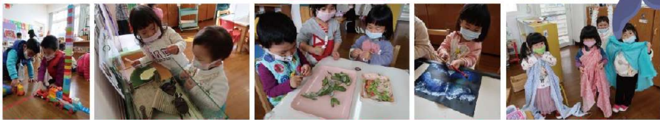
組合建構區 - 自然觀察區(飼養烏龜) - 生活自理區(剝豆子) - 美術區(藍眼淚創作) - 扮演區