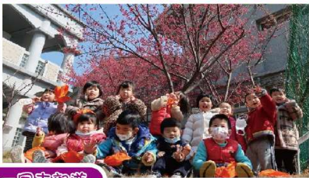
大手拉小手。一同去郊遊