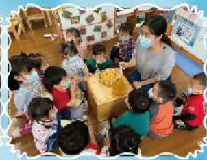
地瓜圓-生與熟的區別