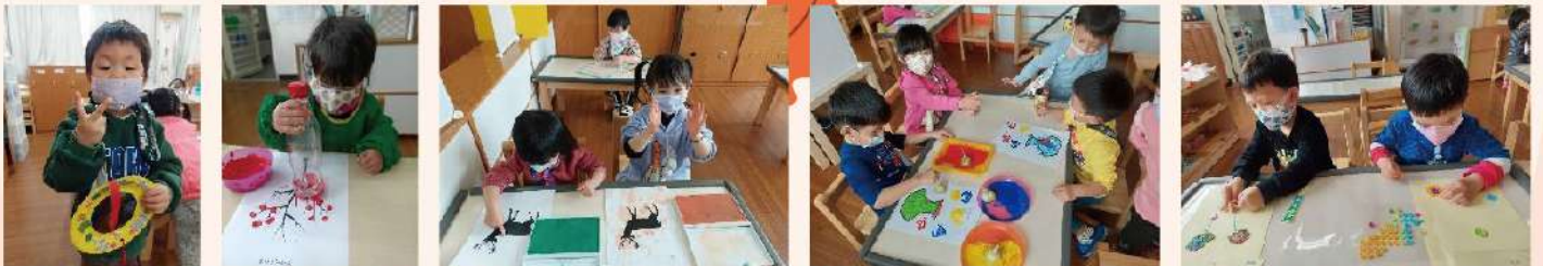
美術創作：紙盤燈籠、寶特瓶蓋印畫、花鹿指印畫、蔬菜蓋印畫、鈕扣花……等等